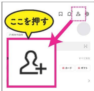
お友達追加を押す