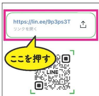
画面に出てくるURLを押す