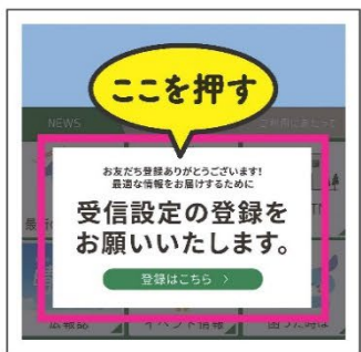
画面下、受信設定の「登録はこちら」を押す