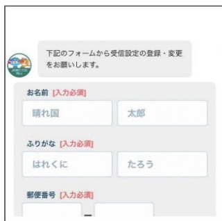
住所・氏名など情報を入力