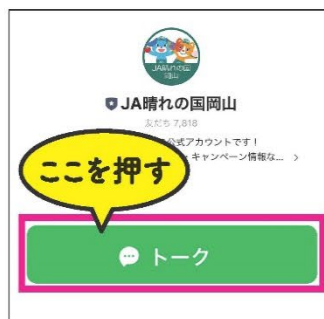
下に出てくるトークを押す