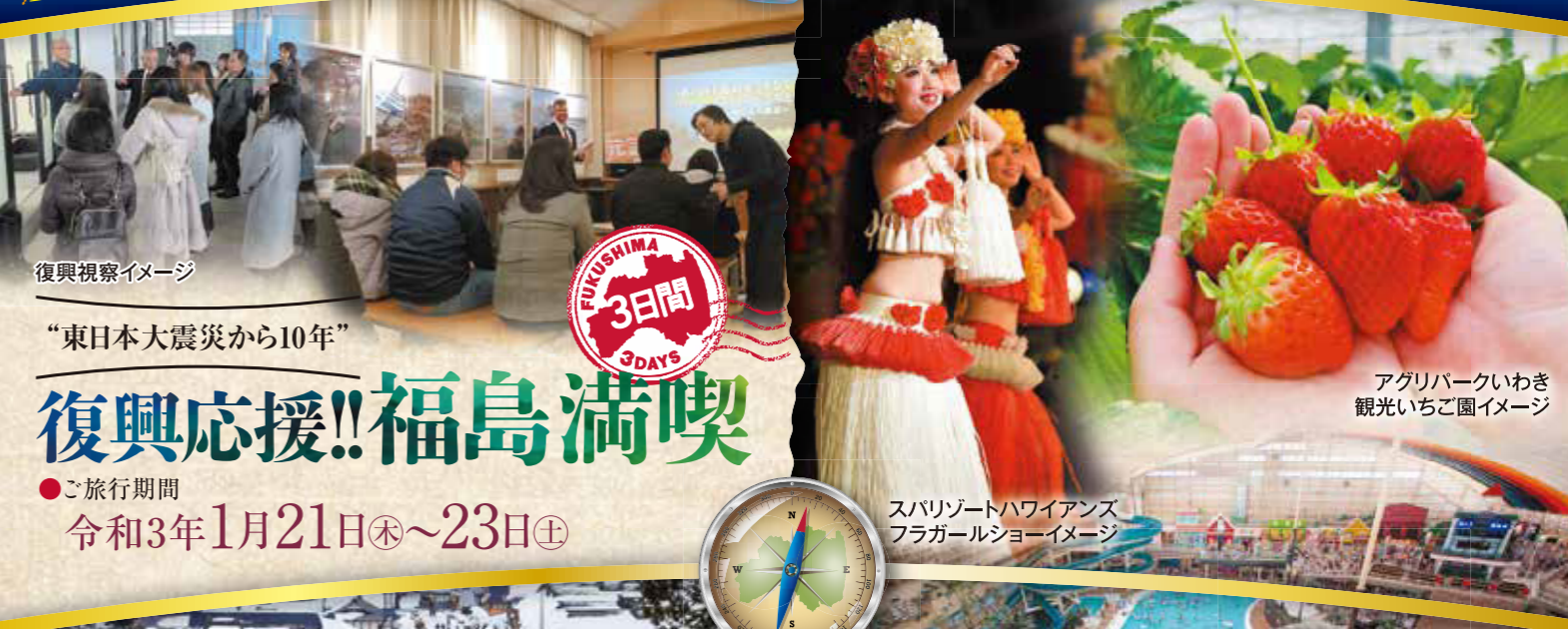
復興視察イメージ