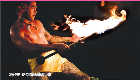
ファイヤーダンス(イメージ)