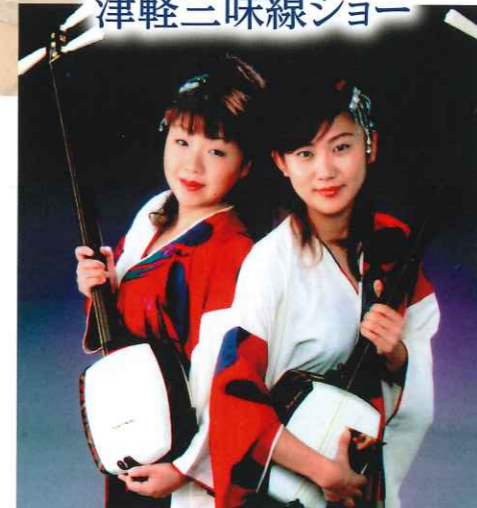
唄と津軽三味線で繊細かつ迫力あるステージをお届けします!