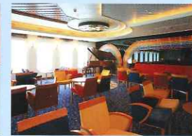
●ダイニングサロン