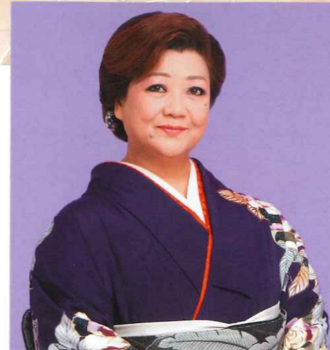
日本レコード大賞 最優秀歌唱賞受賞の大ベテラン。 心のごもった歌声をお届けします。