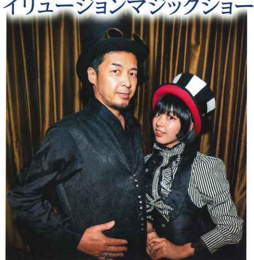
目の前で起こる奇跡のマジックの数々。女性ファンも多く、彼のマジックを見ていると、思わず心を奪われてしまうか...