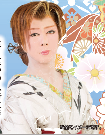
※全てイメージです。