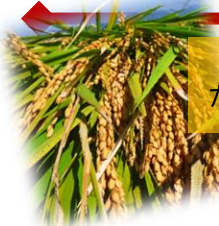
ただいま稲刈り中…

自然もようやく秋らしく。新米やキャベツお待ちかねの声がちらほら聞こえる 10月です。