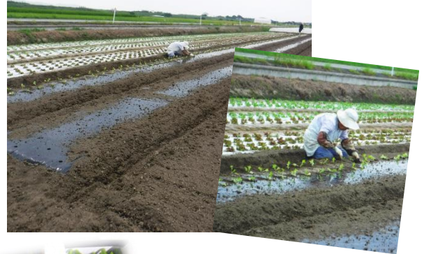
オクラもまだ続きます…